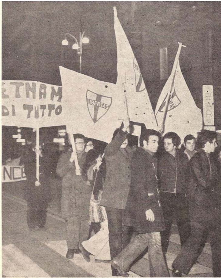
Un momento della manifestazione: le nostre bandiere sfilano per il Vietnam.

inquadrate il problema della pace nel mondo in una visione nuova,